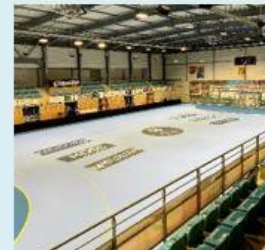
Centre sportif Pierre de Coubertin

Les entraînements de la Section Sportive se déroulent les mardi et vendredi de 15h à 17h . Par ailleurs les joueurs sont accueillis sur les créneaux d'entraînements des -18 ans du Club : le lundi et le mercredi de 17h à 19h .