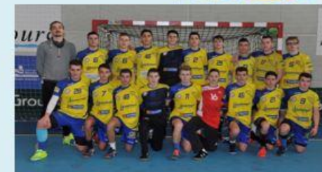
5ème aux Championnats de France UNSS Excellence Lycée à Nantes en Mars 2017