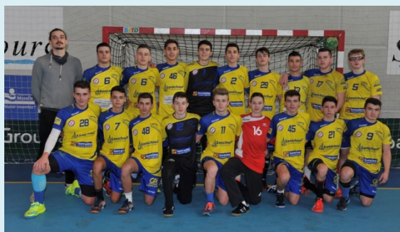
5 ème aux Championnats de France UNSS Excellence Lycée à Nantes en Mars 2017